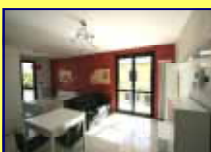
NUOVO BILOCALE ARREDATO BOX € 109.000

SE VUOI ACQUISTARE CASA L'AFFARE LO FAI CON NOI !!!