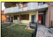
TRILOCALE CLASSE B GIARDINO e BOX € 146.000