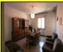
BRIOLO € 95.000 GRANDE METRATURA