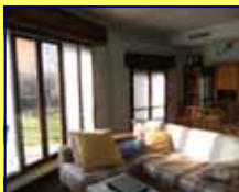
PONTE S. PIETRO € 299.000 GRANDE UNIFAMILIARE